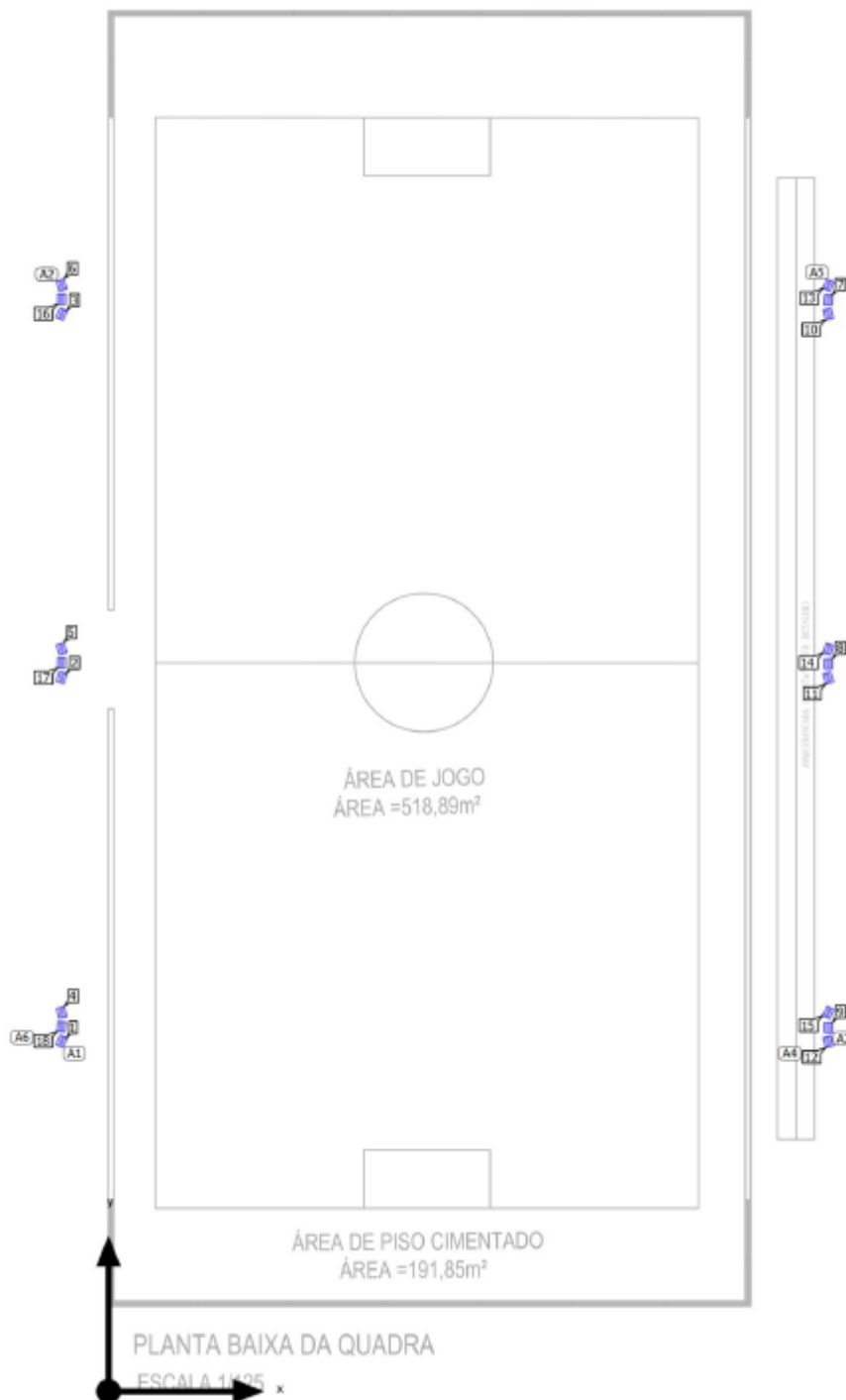
Figura 6 Esquema Posição de Luminária