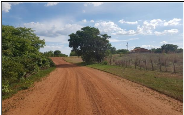
FOTO Nº 19 - TRECHO 08: PI - 236 / LOC. CRUZ ATÉ LOC. MALHADA GRANDE