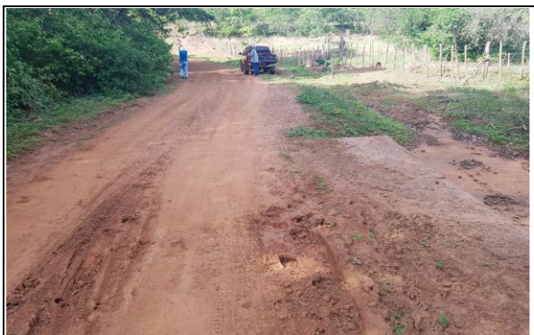
FOTO Nº 09 - PASSAGEM MOLHADA EXISTENTE 02 (6,00 x 10,00)m - E160