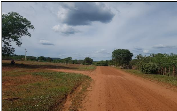
FOTO Nº 01 - INÍCIO DO TRECHO 08: PI - 236 / LOC. CRUZ ATÉ LOC. MALHADA GRANDE