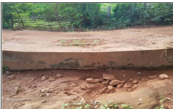
FOTO Nº 11 - PASSAGEM MOLHADA EXISTENTE 03 (6,00 x 10,00)m - E241