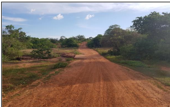
FOTO Nº 22 - TRECHO 08: PI - 236 / LOC. CRUZ ATÉ LOC. MALHADA GRANDE