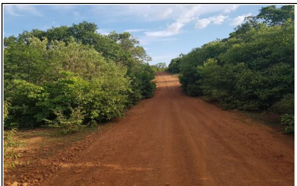
FOTO Nº 21 - TRECHO 08: PI - 236 / LOC. CRUZ ATÉ LOC. MALHADA GRANDE