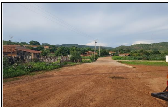
FOTO Nº 24 - FIM DO TRECHO 08: PI - 236 / LOC. CRUZ ATÉ LOC. MALHADA GRANDE