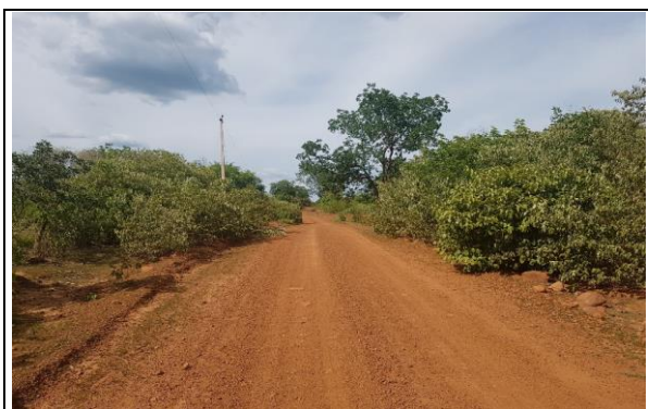
FOTO Nº 17 - TRECHO 08: PI - 236 / LOC. CRUZ ATÉ LOC. MALHADA GRANDE