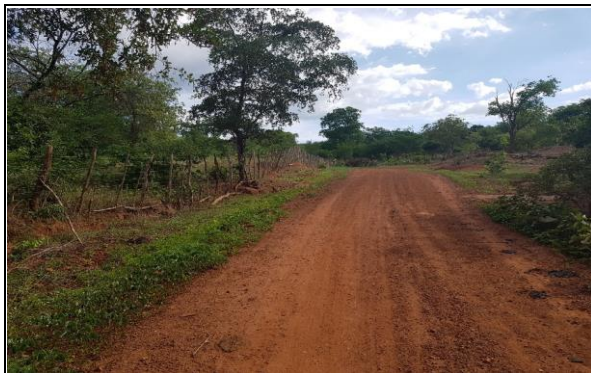
FOTO Nº 20 - TRECHO 08: PI - 236 / LOC. CRUZ ATÉ LOC. MALHADA GRANDE