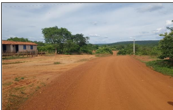
FOTO Nº 18 - TRECHO 08: PI - 236 / LOC. CRUZ ATÉ LOC. MALHADA GRANDE