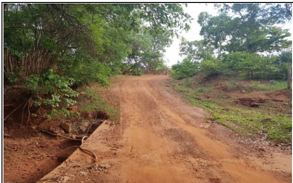
FOTO Nº 07 - PASSAGEM MOLHADA EXISTENTE 01 (6,00 x 10,00)m - E107