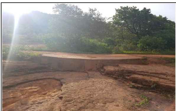
FOTO Nº 15 - PASSAGEM MOLHADA EXISTENTE 04 (6,00 x 10,00)m - E330